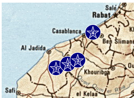
Figure 1. Zone d'étude du régime alimentaire de la Chouette effraie dans les plaines semi-arides du Maroc. 1 : Doukkala, 2 : Oum-Er-Rbia, 3 : Chaouia, 4 : Mohammedia

Nous avons complété nos travaux en 2003 et 2004 dans ces trois régions, et nous avons également pu collecter de nouveaux lots de pelotes plus au nord, au voisinage de la ville de Mohammedia.