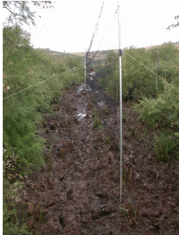
Le relevé des filets (photo J. Cortes, 26 mai 2005)