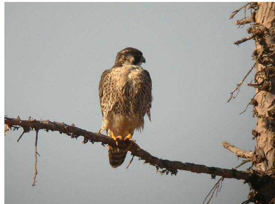
Falco pelegrinoides juv. – Plaine du Souss, 14 janvier 2004 (H. Huhtinen & P. Laaksonen)

Turnix mugissant – Andalusian Hemipode Turnix sylvaticus RB (0/0, 1/1)