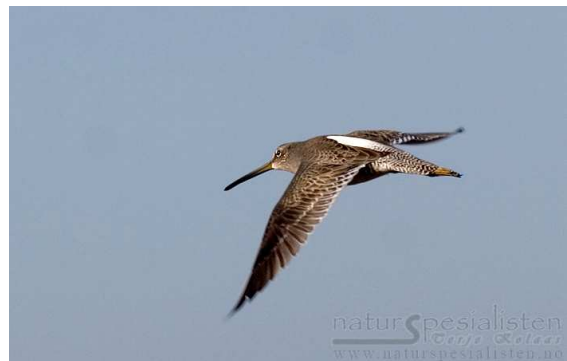
Limnodromus scolopaceus – Embouchure Oued Souss, 28 novembre – 2 décembre 2005

Huitième mention marocaine, la cinquième à l'embouchure de l'Oued Souss qui s'avère être une excellente zone pour cette espèce néarctique.