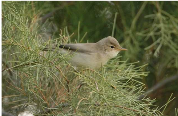
Hippolais pallida – Merzouga, 13 avril 2006

the picture) shows a much sandier / paler overall plumage than Western Olivaceous (which look much warmer brown), it depicts the smaller, thinner bill than opacus, shorter wings and suggestion of a pale wing panel. In life, the bird 'appeared' much smaller than opacus noted earlier, it also had the habit of 'dipping' its tail, which we never noted on Western Olivaceous. Its song was quicker and less melodious than opacus, much more akin to Eastern Olivaceous.... The bird preferred to sing from tamarisk bushes despite their being much variety nearby...'