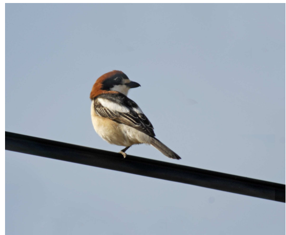
Lanius senator badius – Aoulouz, 5 avril 2006

Le passage de quelques individus de cette sous-espèce, qui niche sur les îles Baléares, en Corse et en Sardaigne, est probablement régulier surtout au printemps mais passe largement inaperçu. C'est pourquoi nous encourageons tous les observateurs à prêter une attention particulière à cette forme et à nous transmettre leurs observations. Une bonne mise au point bien illustrée sur les critères d'identification de cette forme est consultable sur le site Ornithomedia à l'adresse www.ornithomedia.com/pratique/identif/ident_art64_1.htm .