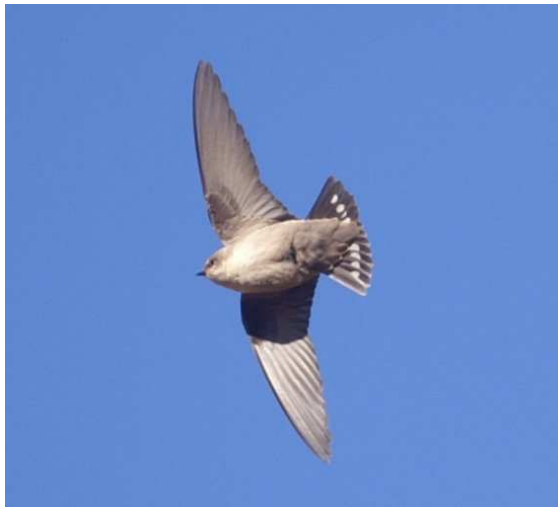
Ptyonoprogne fuligula – Aouinet Tozkoz, 10 janvier 2006

Bergier (2007) a récemment synthétisé nos connaissances sur cette espèce au Maroc.