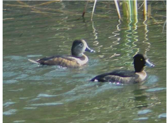
Aythya collaris – Massa, 6 février 2003

Bonne année pour cette espèce. L'observation au Barrage de Layoune constitue la seconde dans le Sahara atlantique et cette arrivée correspond avec le passage de la violente tempête qui a balayé les Canaries fin novembre.