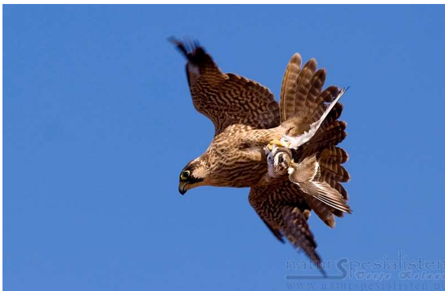
Les faucons de l'embouchure de l'Oued Souss, 29 novembre 2005, T. Kolaas (www.naturspecialisten.no)