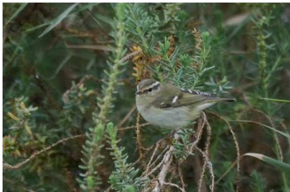
Phylloscopus inornatus – Kasbah Derkaoua, 23 novembre 2005 (haut) et embouchure du Souss, 19 novembre 2005 (bas)