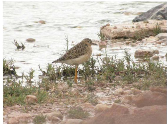
Tringytes subruficollis – Ouarzazate, 24 avril 2006

Hugues Dufourny commente : 'Découverte plutôt incroyable que ce Bécasseau rousset en plein désert près de Ouarzazate. Sans doute bloqué là par les mêmes conditions météorologiques [froid, neige sur l'Atlas] qui retenaient les nombreux autres limicoles présents à cet endroit, ce Bécasseau rousset apporte la deuxième donnée pour le Maroc (le précédent est du 26 septembre 1998 à l'embouchure de l'Oued Souss – Thévenot et al. 2003). L'oiseau, qui se nourrissait parmi les autres limicoles ou plus à l'écart, pu être longuement observé et photographié. Il ne fut pas retrouvé lors de notre second passage les 27 et 28 avril'.