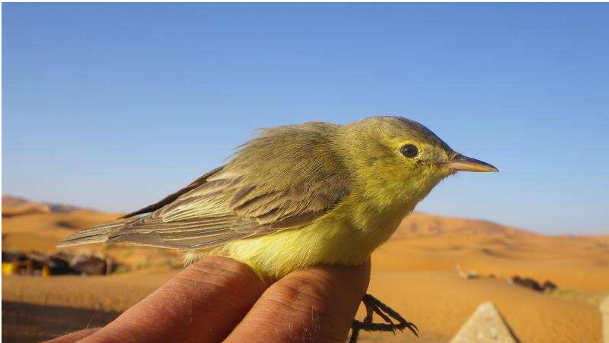
Hypolaïs ictérine (dossier 13/24), Auberge Yasmina, Merzouga, 24 avril 2013 (S. Claden)