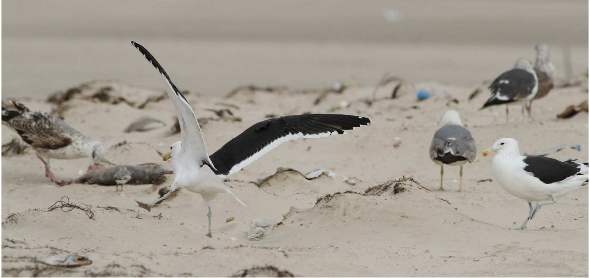
Deux Goélands du Cap (dossier 12/94), Pointe de la Sarga, 5 février 2012 (R. Jåbekk et al. )