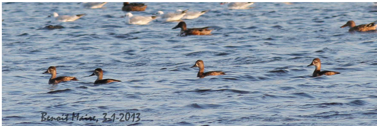
Quatre Fuligules à bec cerclé (dossier 13/48) Sidi Brahim, 3 janvier 2013 (B. Maire)