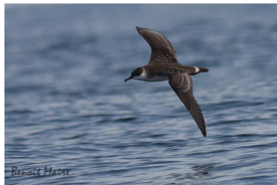
Puffin majeur (dossier 12/136) au large de Bouznika, 9 septembre 2012

Ces observations ont eu lieu entre 8 et 10 km de la côte, à des dates correspondant au passage pré-nuptial (nidification sur les îles de l'Atlantique Sud).