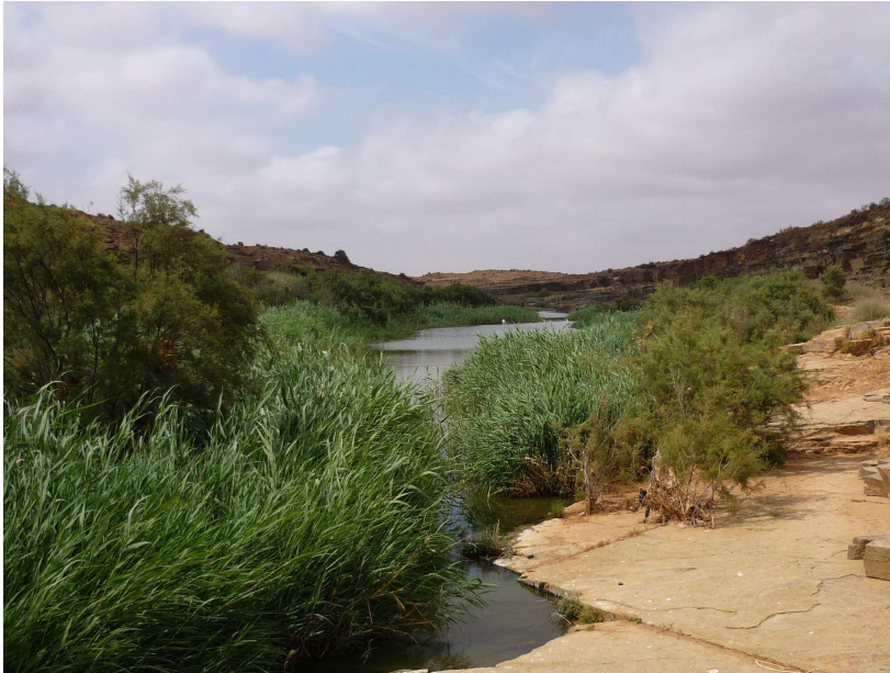
Les gueltas de l'Oued Assaka, 25 mai 2009